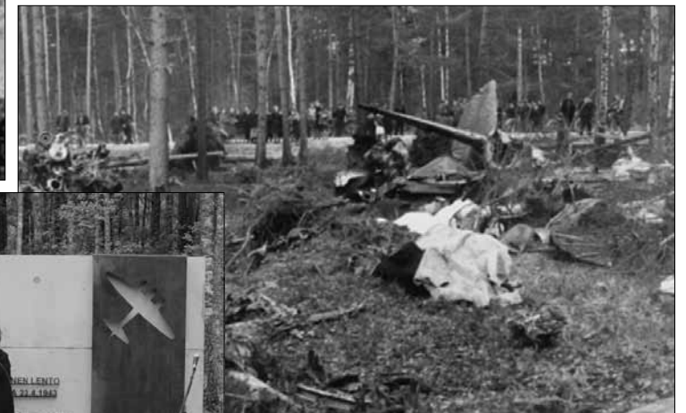
Suomalaislentäjien muistolle pystytetty muistomerkki paljastettiin 4.6.2013 onnettomuuspaikalla Latviassa.

Junkers 88 -pommikoneen siirtolento kohtasi vaikeuksia heti alusta alkaen. Ongelmat kävivät kohtalokkaaksi Saulkrastissa Riian lähistöllä 23.4. 1943.