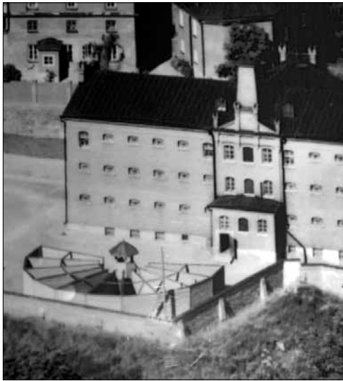
Linnan vieressä oleva vankien "kaku".

linnaan jäi kissa. Tarinaa kerrottiin koululaisryhmälle ja kierron päätteeksi parittyttyä sanoi kuulleen kissan nau'untaa.