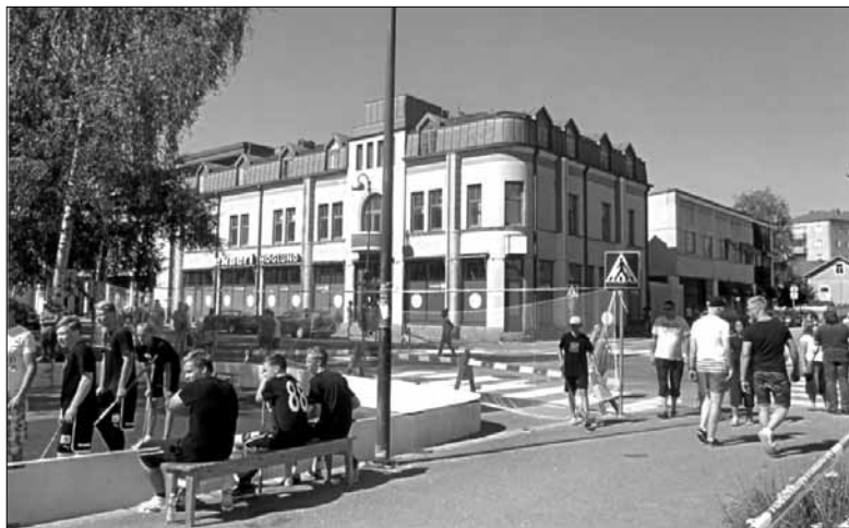
Pietarsaaren keskusta on rakennettu vanhan, ruutuasemakaavan mukaisesti. Kaunis liiketalo, mahdollisesti hotelli, ihastuttaa matkailijaa torin kulmalla. Meneillään ovat perinteiset Jakobstad karnevaalijuhlat, Jaakonpäivän kunniaksi.