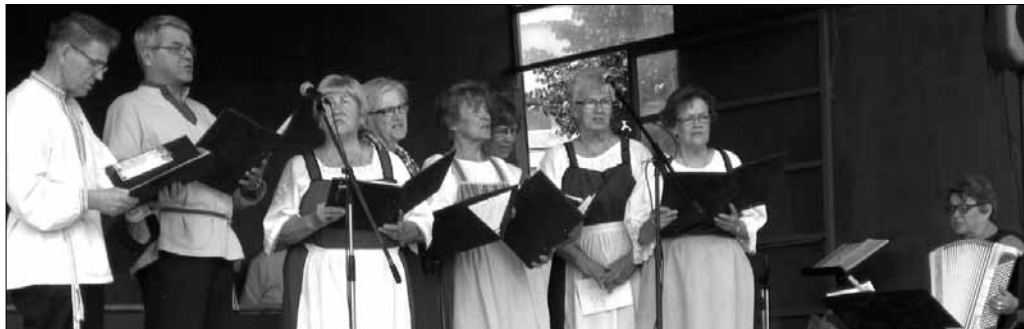
Siilinjärven kansalaisopiston karjalaisten opintopiiri vaalii iloista ja laulavaa perinnettä.

jelmaa seurasi arviolta 800-1000 henkeä.