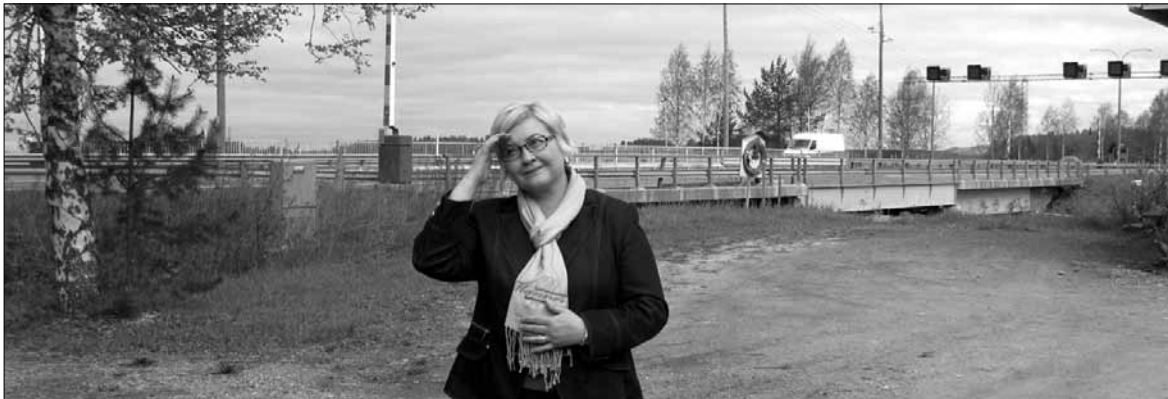
Liikenneministeri Anu Vehviläinen Kallan läppäsillan, ”Saksan seisijan” tuntumassa hankepäättöksen aikaan.