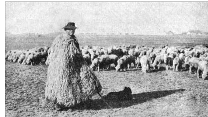
Lammaspaimen koirineen Unkarin pustalla.

Perhesiteet näyttävät olleen verraten lujat. Meidän vanhimmissa kivikauden löydöissä on myös piirteitä, joitten johdosta on oletettu asuneen suomalais-ugrilaisesta kansaa. Se sivistys, jonka suomalais-ugrilainen alkukansa omisti, oli suoranaista jatkoa uralilaiselle alkukansalle, vaikkakin jo tätä kehittyneempi.