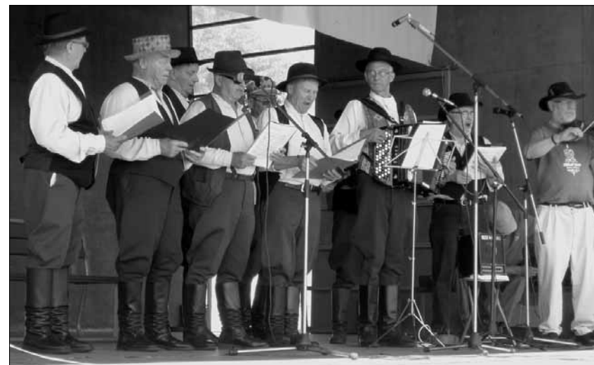
Nilsian pussihousukerhon miehet esittivät hauskaa ja haikeaa Tahkon takaa.

Nilsian emännät eivät koskaan ole jääneet metsän taakse ruikuttamaan. Kerran lähti isäntä etelänmatkalle ja sähkötti kotiin kahden viikon päästä ”Tiällä on lystiä. Myy Mansikki ja lähetä rahhoo.” Kun isäntä palasi, emäntä lähti vuorostaan reissuun. Parin viikon päästä tuli häneltä viesti. ”Tiällä on lystiä. Tässä on rahat,