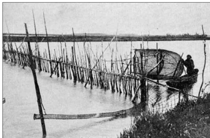
Ostjakkien kalanpyydyksiä Obilla. Vastaavaa pyyntitekniikkaa on käytetty vielä meidän aikammekin joskin kehittyneemmillä välineillä.

Mutta myöhemmin, kun kriittinen tutkimus pääsi vallalle, hylättiin monet hatarat käsitykset. Tämän alun teki ”Suomen historian isä”, Henrik Gabriel Porthan . Hänen jälkiänsä on sitten seurannut huomattava joukko eteviä tiedemiehiä. Näiden