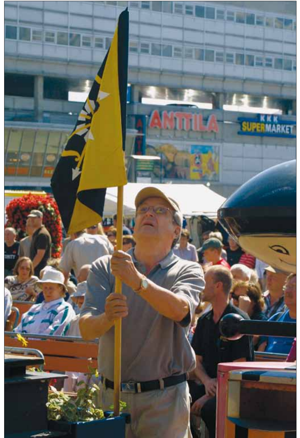
“Isän murre ja äetiltä kieli meelle perinnöks annettu on. Sitä tallentoo pitää ja huastellakkii. Tämä taeto on korvoomaton.”