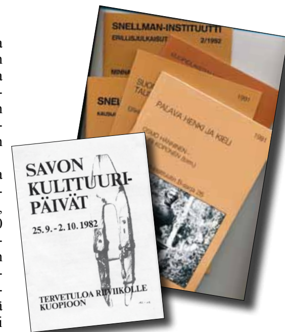
Savon kulttuuripäivien ja Snellman-instituutin yhteistyönä syntyneitä julkaisuja.

Tähänastisen toimintansa aikana Savon kielen seura on ollut panemassa vireille tai toteuttanut lukuisia muistomerkkihankkeita, kaikki mukaan laskien niitä saattaisi olla yhtä paljon kuin seuralla on ikävuosia. Kalevalan ilmestymisen 150-vuotisjuhluvuonna 1985 paljastettiin seuran vireille saattamia lukuisia muistomerk-