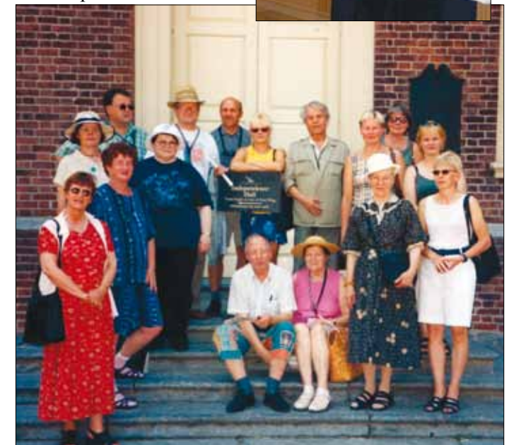
Ennen FinnFest 2001 – tapahtuman alkamista tutustuttiin Philadelphiassa Itsenäisyyden museoon.