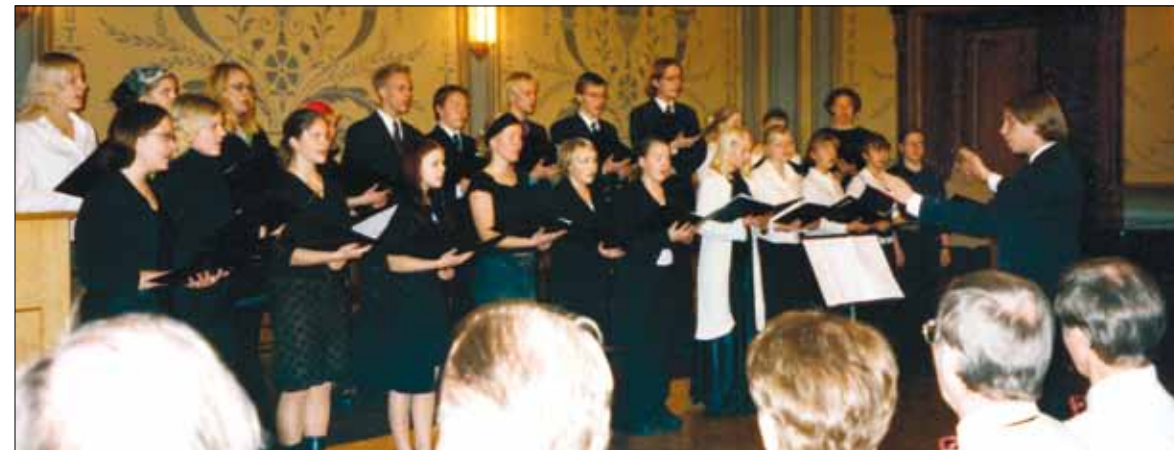
Ylioppilaiden kuoro esitti 9.12.2002 juhlassa Savolaisen laulun seitsemällä kielellä.