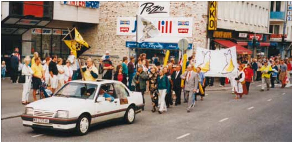
Savon kielen seura Tuhatvuotinen Savo -juhlakulkueessa 13.8.2000 Kuopiossa.