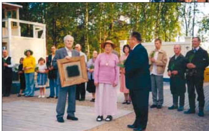
Kuopion murretorin ohjelmaa v. 2011 Taide- torin yhteydessä.