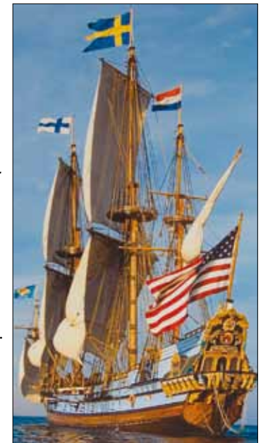
Kalmar Nyckel-lai- va kuljetti v.1638 Amerik- kaan Ruotsista lähteneitä siirtolaisia. Laivasta on raken- nettu kopio.