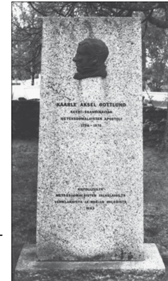
Carl Axel Gottlundin muistomerkki Juvalla.

Mutta nyt ollaan laataa naulaamassa. Minä olen kulkenut mustissani paikalle Snellmaninkadun ja Kirkkokadun kulmassa sijainneen lähikaupan kautta ja tehnyt asiaa itse kauppiaille: -Antasijako työ parj roi-