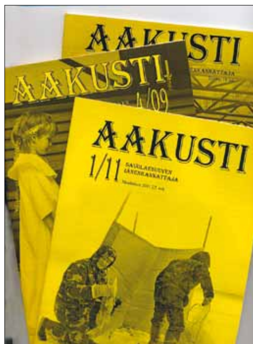
Aakustista ilmestyy jo 23. vuosikerta.