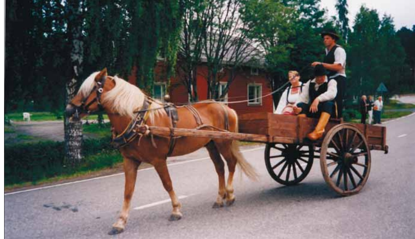
Vehmersalmelaisten perinnekulkueeseen kuului komea hevospelin kärryineen 3.7.1999.